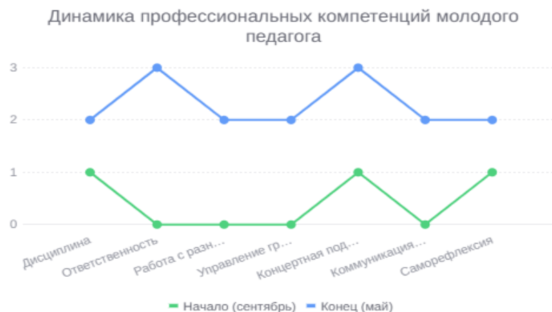
График № 1. Динамика профессиональных компетенций молодого педагога (на основе диагностики - приложение 1 в программе)

Пояснение: Два контура — зеленый (сентябрь) и синий (май). Синий контур выходит за пределы зеленого по всем точкам — наставничество сработало хорошо.