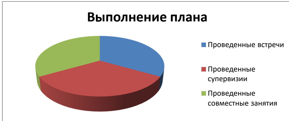
График № 4. Выполнение плана наставничества

Пояснение: Взят средний показатель по 4 молодым педагогам для данного графика. Этот график показывает, как изменилось поведение и мотивация детей , которыми руководят молодые педагоги. Это косвенный, но очень важный показатель эффективности наставника.